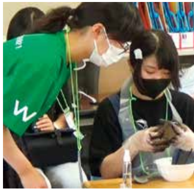
交流会参加生徒と紀州備長炭で箸置きを作りました。画像は沖繩県からの参加者です。全国に友だちが出来ました。

高校生の私たちが補えない部分をサポートして下さった先生方そして、補助員として関わってくださった和歌山高校生のみなさん、一緒に活動できて嬉しかったです。本当にありがとうございました。