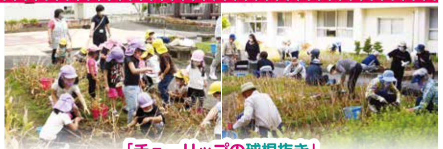
「チューリップの球根抜き」